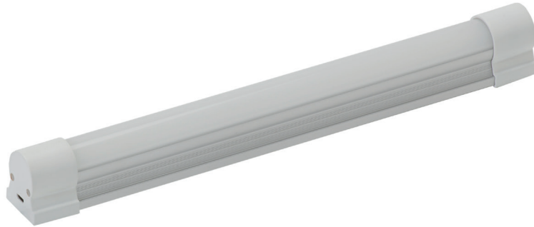
Eclairage / lighting Ref 3682 (Blanc / White)